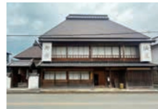
▲復元された旧松崎旅籠油屋の主屋と座敷

【債務負担行為の設定】水泳授業委託業務 3640万円 市内8小学校の水泳授業を民間のスイミングスクール事業者へ委託をするためのものです。スムーズな契約を行うために今年度から準備を行う必要があり、債務負担行為が計上されました。 ※債務負担行為とは、来年度以降の支出を約束する行為です。