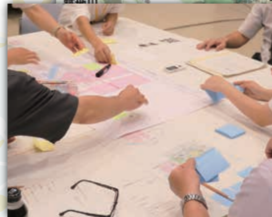
市民とのワークショップで示された新体育館のイメージ鳥瞰図