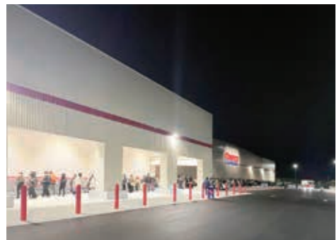
オープン初日、多くの来場者で行列ができていました。

COSTCOのあるまち小郡で認知度は格段に上がりました。これからも持続可能で活力のある、安心安全なまちづくりのためにチーム一丸となって取り組んでいきましょう。