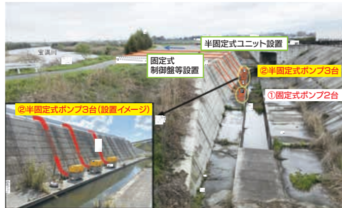
▲大崎地区排水ポンプ施設 整備イメージ写真 令和6年9月議会都市経済常任委員会資料 (都市整備課)

議案第48号 排水ポンプシステムの買入れについて 購入額 1億2094万円 納品期限 平成7年3月14日 大崎ポケットパーク横に設置する半固定式の排水ポンプシステムを購入します。この事によって来年の出水期までには排水整備が整います。