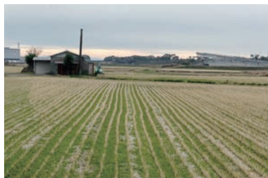
基山町が約10ヘクタールの開発を予定している九州高速道の東側

交通利便性の良さから小郡にはコストコが、鳥栖にはアサヒビールが、その他多くの企業がこのエリアには注目をしています。それぞれの市町の現在の開発への取り組みと課題について意見交換をしました。中でも基山町が進めている九州高速道東側のエリアの開発約10ヘクタールは小郡と隣接して道路や水などで大きな影響が考えられます。保水機能のある田んぼを開発することに対しての浸水に対する不安もあります。市町どころか県も違うので開発基準も違ってくる。今回の意見交換会で流域治水に対して自治体間連携の必要性を伝えました。現在、市も流域治水の取り組みとして10月から宝満川上流域の太宰府市・筑紫野市・筑前町・鳥栖市・基山町と意見交換を行い、ため池等の先行排水や田んぼダムの実施など協力を訴えてきています。これからも執行部と一緒に上流にある他自治体との連携を進めて浸水被害の軽減に努めていきます。