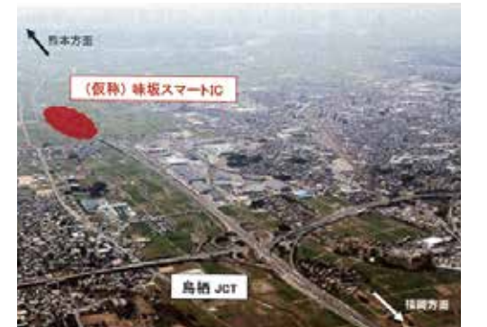
(仮)味坂スマートインターチェンジ

2県2市で協議中の準備会で場所、構造、事業費等の検討を行っております。方向性の合意がとれた段階ですぐに議会と協議をいたします。