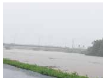
あすてらす横の川の川大橋付近