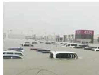
冠水したイオン小郡ショッピングセンター

自然の猛威に驚愕 昨年7月の九州北部豪雨から1年、今年も大雨に襲われました。 今回は日本全体が梅雨前線の影響で大荒れになり、特に西日本では各県で特別警報が出されました。特別警報は数十年に1度しかない重大な災害が起こる恐れが高まった場合に気象庁が発令します。福岡県では昨年が続いている特別警報が発令しました。小郡市でも宝満川の端間水位観測所で氾濫危険水位(4.65m)に達したので16時45分に避難指示を出しています。19時30分頃には5.4mまで水位が上昇して非常に危険な状態でしたが氾濫することなく安堵いたしました。市も各地域に11箇所の避難所を開設しました。20時50分で190世帯、567名の方が避難をされたそうですが、大幅に氾濫危険水位を超えていた状況を考えれば、自分は大丈夫だろうという気持ちがあったのではないのでしょうか？ 自然の猛威の前ではどうすることも出来ません。地球温暖化の影響でしょうか、豪雨に対して今まで以上の危機意識と事前の備えが必要だと強く感じました。