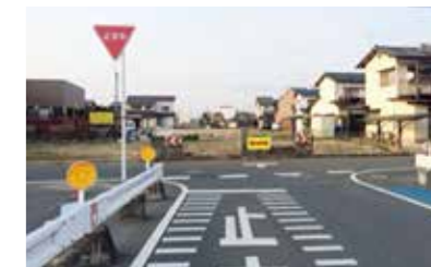
（開2～国道500号線）は平成29年3月末開通予定