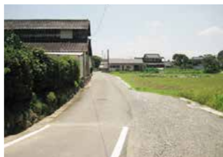
28年度で完成予定の3082号線

主な歳出 道路新設改良費 9430万円 小郡・西福童3081・3086号線及び3082号線の市道を拡幅、改良工事をするものです。