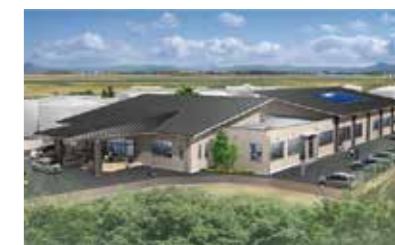
大原小学校の運動場西側に新設される大原校区公民館の完成予想パース

すべての子ども・子育て家庭を対象に支援の質・量の拡充ができるよう、予算拡大、および職員の処遇、配置基準の改善を図るよう要望いたしました。