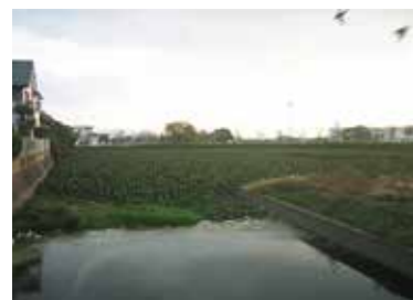
水草(ホテイアオイ)でいっぱい 2009年当時の山添池

先人たちが生活の糧のために苦勞をして作られた水路やため池ですがその利用内容が大きく変わってきている今、管理についても考えなければならぬ時になっていきます。ため池や水路の管理についてはたくさんの方の苦情が市に寄せられています。私も2009年の9月議会で水草(ホテイアオイ)やゴミの問題で悪臭など衛生的な問題が生じているその改善についてどうするのか市に対して問題提起をしました。未だに解決がなされていません。市が担当する課だけでも、農業のため池、水路、水路の管理は建設管理課、悪臭などの問題は生活環境課など多くの部署にまたがっています。市は水利組合に管理をお願いします。願いをしていると言いますが、地域性を考えて基本的に変えていかなければ解決はしません。永年の懸案事項ですが課題解決に向けて取り組んでまいります。