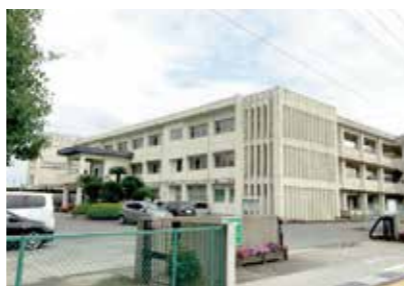
1年遅れましたがトイレ施設の全面改修がなされる小郡中学校