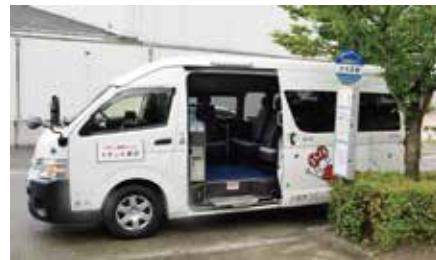
運行が始まった12人乗りコミュニティバス、ルート再編やダイヤ改善など、より一層の利便性向上が求められています。