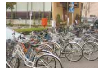
小郡駅前の放置自転車、条例制定で抜本的な改善に取り組みます。

小郡市自転車等の放置防止に関する条例の制定について 公共の場所での放置自転車等の対策として(小郡駅周辺を予定)