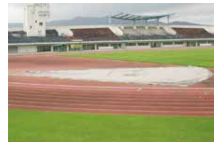
7月～2月までの予定で工事を行います。ご迷惑をおかけいたしますが期間中はご利用できません。

小郡市陸上競技場改修工事請負契約の締結について 請負者 奥アンソーカー株式会社 西日本支店 契約金額 1億5500万円 工事概要 ウレタン舗装、付帯施設改修及び新設 コースライン改修 等 平成24年の野球場バックスクリーン工事に続き totoスポーツ振興交付金から8000万円の補助を受け工事を行います。現在2種公認は県内では小郡市と大牟田市の2つの競技場だけです。