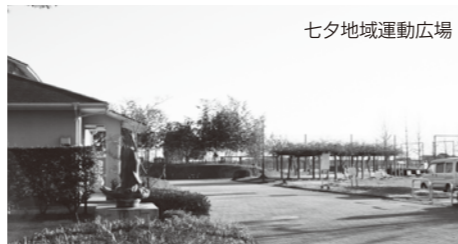
七夕地域運動広場