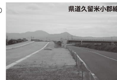
県道久留米小郡線

②避難勧告等の発令・伝達マニュアルを含めて水防計画書の見直しをしており、計画書の作成が遅くなっています。6月末までには作成をして、関係者に周知をしたいと考えています。