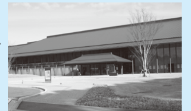
10月に簡保レクセンター跡地に開業した、県立九州歴史資料館

観光事業への取り組みについて、大刀洗平和記念資料館など近隣の観光施設との連携をやっているのか質問。現在はやっておらず、昨年10月開業の九州歴史資料館や3月に開通する九州新幹線を含めて連携を考えているとの答弁がありました。クロスロードに位置し様々な可能性を持った交通の便利のいい小郡市です。もっと積極的に取り組むように要望。