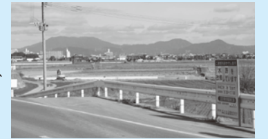
整備中の築地川と正尻川の雨水幹線。

避難場所の確保、自主防災組織の結成についてと、雨水幹線の整備について質問。自主防災組織はまだ結成されておらず、現在調整をしているという事でした。雨水幹線は無堤区間を無くし、宝満川のかさ上げ、逆流の防止を計画的に整備中であるとの答弁がありました。 ゲリラ豪雨に限らず、慢性的に冠水する道路があるという事を伝えて早急な対応を要望。