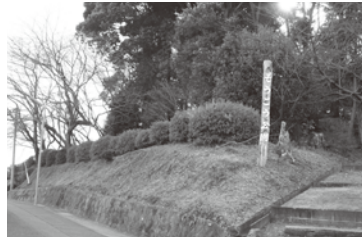
整備計画のみくこの団地総合公園