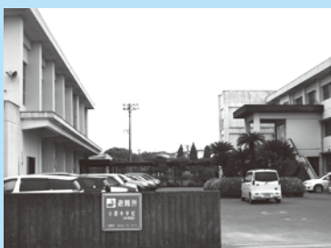
▲耐震化が必要な市内の小・中学校