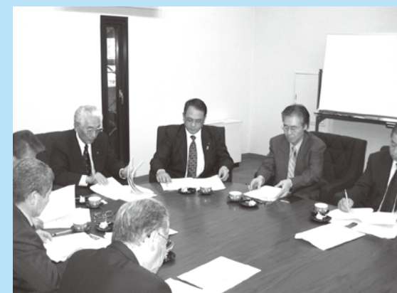
▲清和会で大分市議会を視察