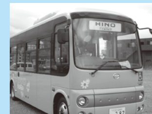
◀コミュニティバス