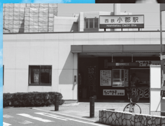
バリアフリー化事業が実施される西鉄小郡駅