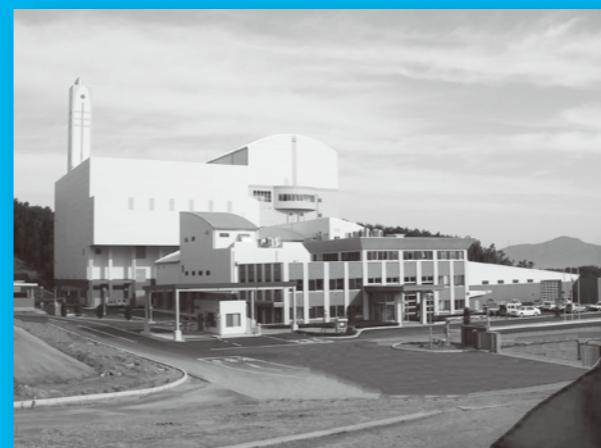
本格稼働が始まったクリーンヒル宝満