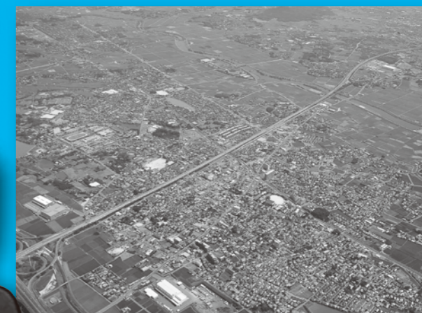
空から見た小郡市