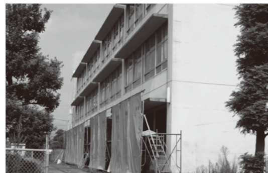
夏休み期間での大原小学校の改修工事

西鉄小郡駅のバリアフリー化事業 (エレベーターを3基設置) 後期高齢者医療制度が県の広域連合で開始 ゴミ処理施設のクリーンヒル宝満が稼働 商店街活性化がんばろう会事業 消防団第2分団2部の施設整備事業 (消防小屋新築、ポンプ車購入) 大原小学校の耐震補強および大規模改修工事