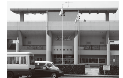
来年3月で指定管理者の契約が切れる野球場

貯金 (基金) は 平成18年度末に21億円あった貯金が平成19年度末に9億5千万円になり、平成20年度末には5億5千万円になる見込みです。 収入 (歳入) は 市税が63億円、地方交付税が32億円と昨年とほぼ同じでこれからすぐに増えることも望めません。 支出 (歳出) は 支出全体で占める投資的経費の割合は平成15年が23%、平成16年が20%、平成17年が14%、平成18年が13%とわずか4年で10%も少なくなっていて新しい事業を行うのが厳しい状態です。