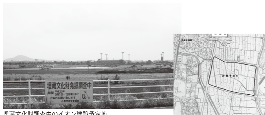
埋蔵文化財調査中のイオン建設予定地

議案第36号 小郡市文化財保護基金条例の制定 イオンより大保地区の文化財発掘調査の為、1億5200万円を受託。 調査事業が複数年にかかるため基金条例を制定して事業を実施します。