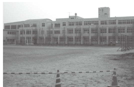
生徒の増加により増築される三国中学校