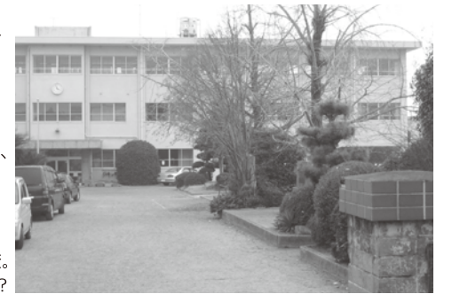
H12年に大規模改修をした小郡小学校。 耐震は大丈夫か？

質問② 放置自転車・バイク対策について 駅を中心に迷惑駐輪が目立ちます。西鉄沿線には8ヶ所、約4,200台分の無料駐輪場がありますが、現在取られている市の放置自転車に対する対策は？