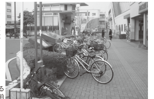
放置自転車がある 西鉄小郡駅前

会報誌のスペースの都合で随分かいつまんでご紹介をしましたが、市役所ホームページの市議会会議録にて、一言一句まで詳細に掲載されていますので、是非ご覧になってください。