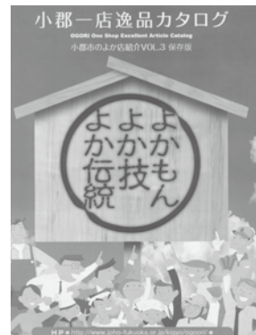
全家庭に配布されたカタログ