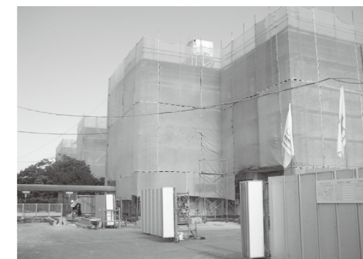
大規模改造中の三国小学校

三国小学校校舎大規模改造工事請負契約を締結しました。 請負者:金子建設株式会社 契約金額:2億7,510万円