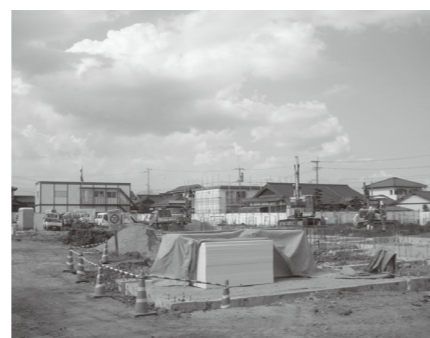
建設が進んでいる東野校区公民館