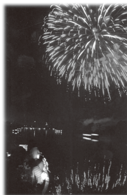
7月29日に開催された「夢HANABI 2006」

東野校区公民館新築工事請負契約を締結しました。 請負者:大石建設株式会社 小郡営業所 契約金額:2億1,525万円