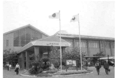
総合保健福祉センター「あすてらす」