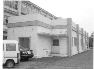
自校式が始まった味坂小学校給食室