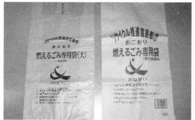
使い安く改良されたごみ袋